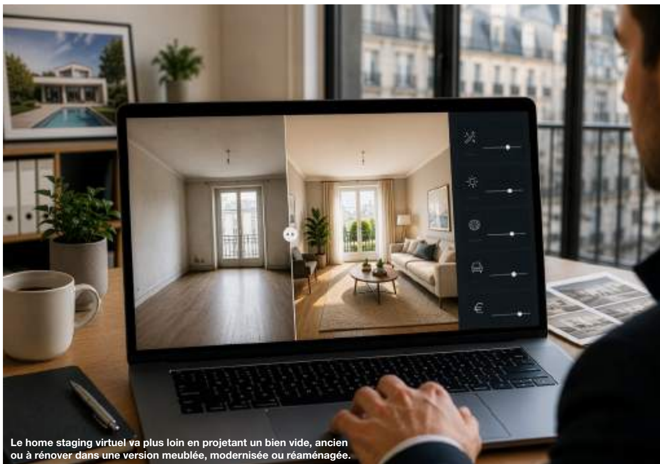
Le home staging virtuel va plus loin en projetant un bien vide, ancien ou à rénover dans une version meublée, modernisée ou réaménagée.