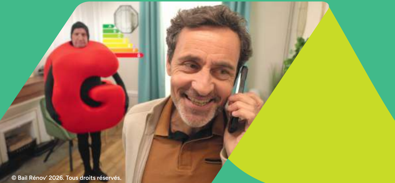
© Bail Renov' 2026. Tous droits réservés.

Service d'information gratuit sur la rénovation énergétique dédié aux propriétaires bailleurs et aux locataires.