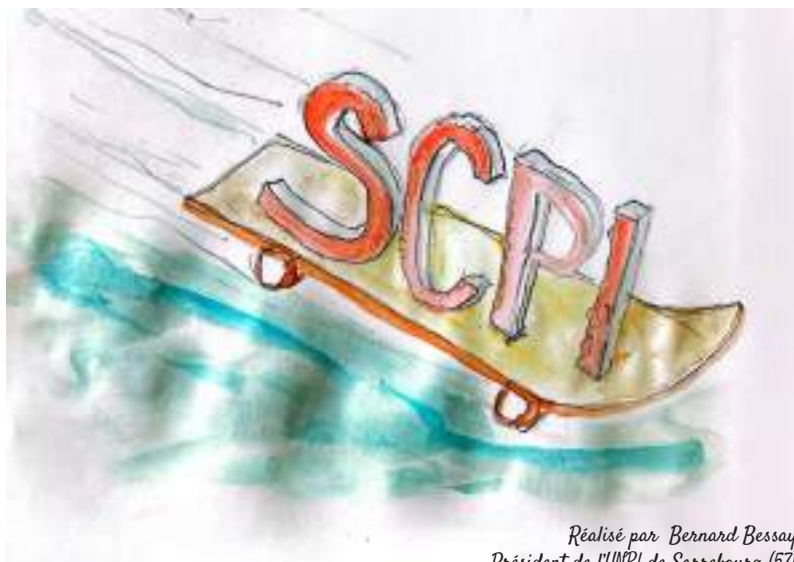
Réalisé par Bernard Bessay, Président de l'UNPI de Sarrebourg (57).

Longtemps centrées sur les bureaux et les commerces, les SCPI diversifient progressivement leurs investissements vers d'autres classes d'actifs. Les